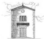
Sant'Antonio da Padova al Romito