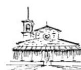
Santo Stefano in Pane a Rifredi